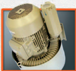
Industriële motor rechtstreeks gekoppeld aan de Siemens turbine.

Moteur industriel directement relié à la turbine Siemens.