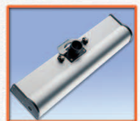
Hulpstukken - Accessoires