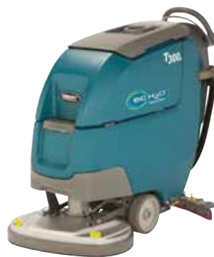
Dubbele schijf: 600 mm