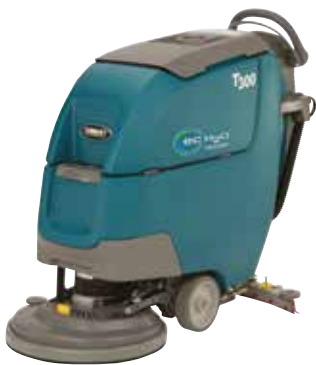
Eén schijf: 430 mm & 500 mm

De T300 schrobzuigmachines beschikken over meerdere koppen die beantwoorden aan uw reinigingsbehoeften en een optimale reiniging mogelijk maken.