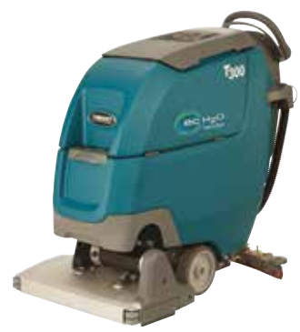
Dubbel cilindrisch: 500 mm