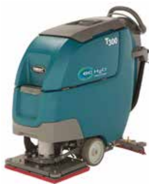
Orbitaal: 500 mm