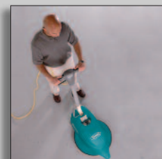
Machine in actie